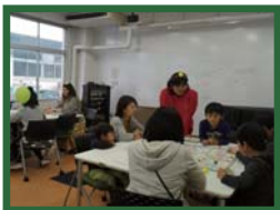
明石高専での展示にて