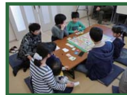
小学生を対象に地域の自治会と共催