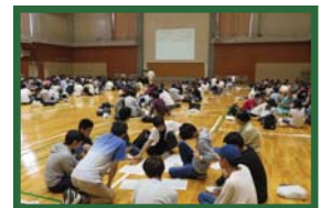
2日目：チャレンジ!実施