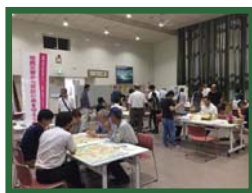
淡路で開催された 「防災・減災メッセ」にて