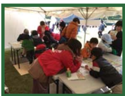
2017 西日本 B-1 グランプリ in 明石 体験コーナーにて