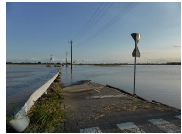
図5 市内の浸水状況

水海道総合体育館（図8）は、鬼怒川右岸の浸水区域外にある「きぬ総合公園」内の施設で、避難所、常総市の物資拠点、自衛隊の宿泊施設などになっていた。被災地域からやや離れており、停電もなく良好な環境である一方で、避難者は収容可能人数に比して少なかった。救援物資の多くは、屋外に野積みとなっており、学生のボランティアや応援行政職員などによって、主に手作業で荷卸作業が行なわれており、作業効率が良い状態ではなかった。飲料水・主食などには不足はないと認識されているものの、食器やスプーン等の日用品が不足しているとのことであった。また、常総市役所が浸水し通信も途絶していたため、市災害対策本部にはボートで人員が情報連絡にあたっており、市内各地の物資拠点や避難所などの情報収集・共有等が困難ななか、応急対応にあたっている様子が伺われた。