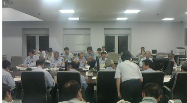
図1 栃木県災害対策本部会議

9月11日の12時半より内閣府副大臣を団長とした政府調査団が県庁を訪問した。知事、副知事、災害対策本部員のほか、日光市長と鹿沼市長も意見交換に同席し、災害救助法の適用、被災者生活再建等への支援などの要望が行われた。11日には16時半から第3回災害対策本部会議が開催され、被害状況の共有が図られた。第4回災害対策本部会議（図1）は、週の明けの14日の15時半より開催され、被害状況と対策の進捗状況が共有されるとともに、課題として、被害の全容把握のため、特に浸水被害の大きい小山市の詳細な情報収集が必要であることが確認された。政府調査団との意見交換、および災害対策本部会議はすべて公開で行われ、終了後は本部会議室内で報道機関による囲み取材が行われていた。