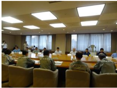
図9 宮城県災害対策本部会議