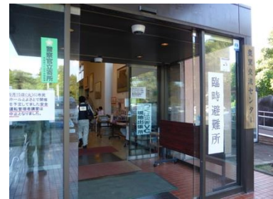
図7 豊里交流センター