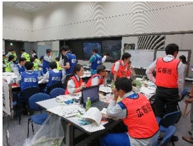
図2 茨城県災害対策本部での執務状況

11日11時30分からは、第5回目となる災害対策本部会議（図3）が開かれ、この時点の優先対策事項として常総市の行方不明者25名の対応状況が確認された。また、避難所収容人数は、常総市で4,501名に達し、下妻市、古河市でも1千人を超えるなど多数に及んでいた。なかでも常総市が広域的に浸水しており被災者が最多であるなか、市役所が浸水と停電等により行政機能が低下しており、通信が途絶し情報が入ってこないことなどが喫緊の課題として報告された。