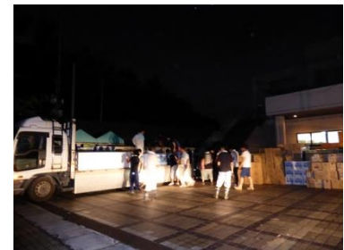
図8 水海道総合体育館