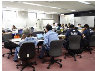
図10 宮城県庁内のリエゾン