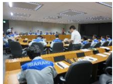
図3 茨城県災害対策本部会議