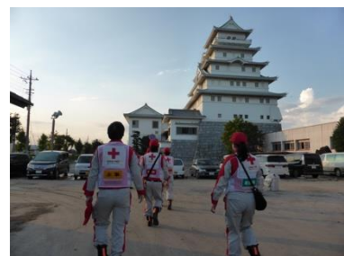
図4 地域交流センター

地域交流センター（図4）は、被害の甚大な常総市石下地区の避難所であり、常総市で最大人数の被災者1,110名が避難していた（9月11日午前2時現在）。停電や上下水道の断水のため、館内は暗く、トイレも使用不可能であった。仮設トイレも届いておらず、施設も1階部分が浸水したため、衛生環境が悪化していた。救護所は設置されており、保健師が待機し、体調を崩した人は消防が搬送する体制がとられていた。避難所運営の職員によると、昼間は多くの被災者は自宅の様子を見に行っているものの、日暮れとともに多くの被