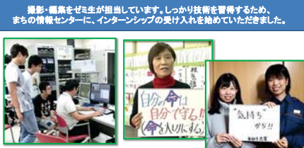
撮影・編集をゼミ生が担当しています。しっかり技術を習得するため、まちの情報センターに、インターシップの受け入れを始めていただきました。

大好評の防火CM。これまでに約3,500回放送。出陣した地域住民は、お年寄りから子供まで、600人近くになりました。4か年計画で、うちの10人に1人は参加するキャンペーンに育てる予定です。