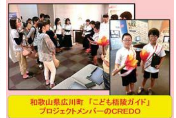
和歌山県広川町「子ども格闘ガイド」プロジェクトメンバーのCREDO