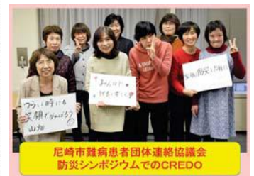
尼崎市難病患者団体連絡協議会 防災シンポジウムでのCREDO