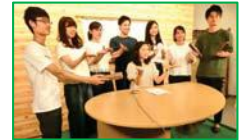
住民アンケートを実施したところ、大学生が制作した防災特番や防火CMを多く見た人ほど、「動みになりました」というポジティブな結果が得られました。次年度は、さらに進化します!