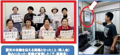
震災の体験を伝える契機となった(上:婦人会) 履みになった-宣紙が実用した(下:被職員)

300名近い住民のみなさまの協力を得て、月めくりのCREDOカレンダーを制作、地区限定で、500部を制作・配布しました! 多くの人から「いいね!」の声が、その効果とは?