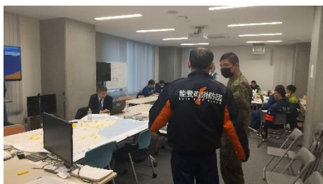
1月7日 能登町災害対策本部