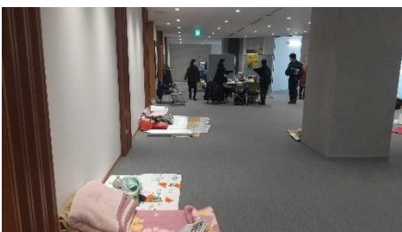
1月7日能登町役場 避難所スペース