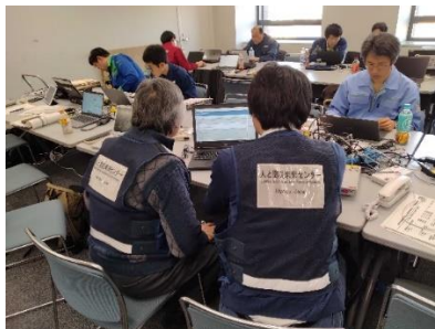
1月2日災害対策本部事務局リエゾン室