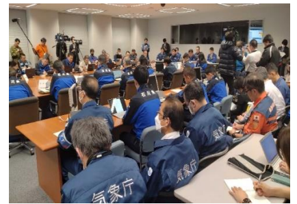
1月2日石川県庁災害対策本部会議