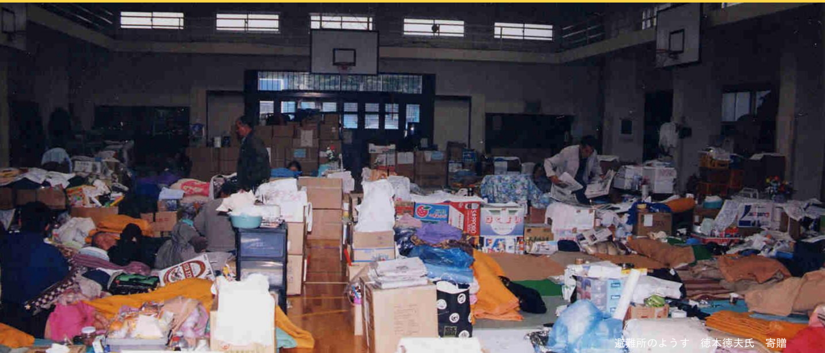
避難所のようす